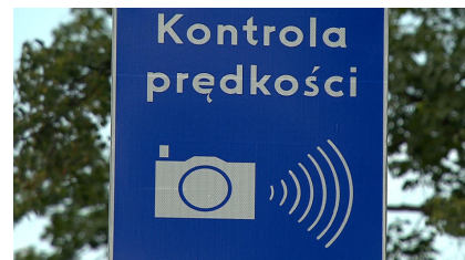
Kamera, prędkość, mandat. Chcą postawić więcej fotoradarów

Kierowca uznał, że było ono bezpodstawne, bo jego zdaniem pojazd nie zagraża porządkowi ruchu. Przekonywał on, że maszyna była sprawna technicznie i spełniała wszystkie szczegółowe warunki dotyczące świateł zewnętrznych - pisze gazeta. Nie naruszał ich brak trzeciego światła stopu, gdyż zgodnie z normami zmienionego w 2016 roku rozporządzenia ministra infrastruktury i budownictwa z 2002 roku wymagane jest posiadanie dwóch świateł stopu. Zagrożenia - w jego ocenie - nie stanowiło również przepalenie jednej żarówki w prawym świetle cofania. Innego zdania byli jednak policjanci, którzy zatrzymali dowód rejestracyjny samochodu.