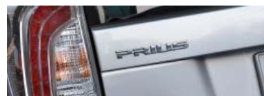
Usterka w Toyotach Prius. Stanowisko producenta