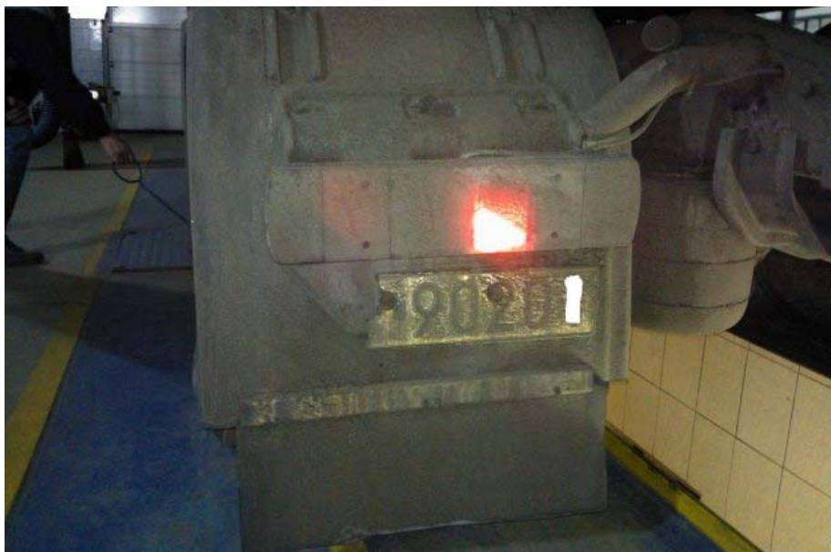
Ciągnik miał tylko kawałek tablicy

Za stwierdzone naruszenia z ustawy o transporcie drogowym i usterki w pojeździe kierowca otrzymał mandat w łącznej wysokości 2,5 tys. złotych. Pojazd trafił na parking strzeżony.