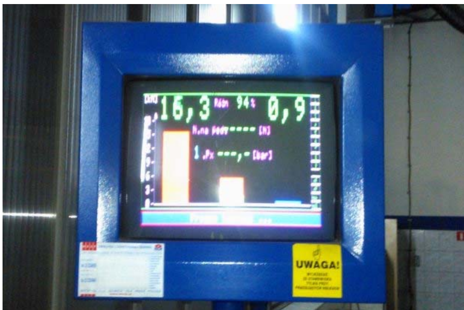
Różnica w hamowaniu na jednej osi okazał się przerażająca

W wyniku dalszej kontroli okazało się, że kierowca nie rejestrował czasu prowadzenia pojazdu, obowiązkowych przerw i odpoczynków.