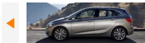
BMW 2 Active Tourer. Jak z coupe zrobić minivana