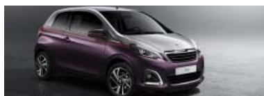
Nowość: Peugeot 108