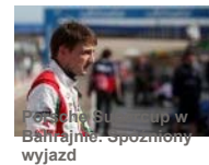
Porsche nie Plan minimum wyjazd